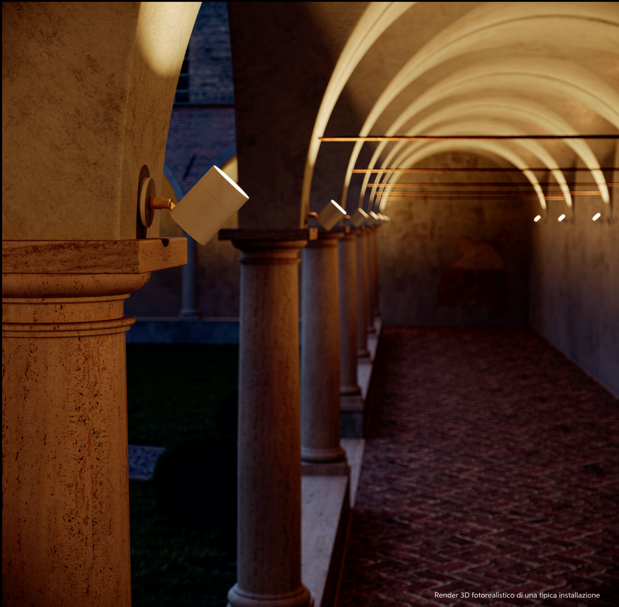
Render 3D fotorealistico di una tipica installazione